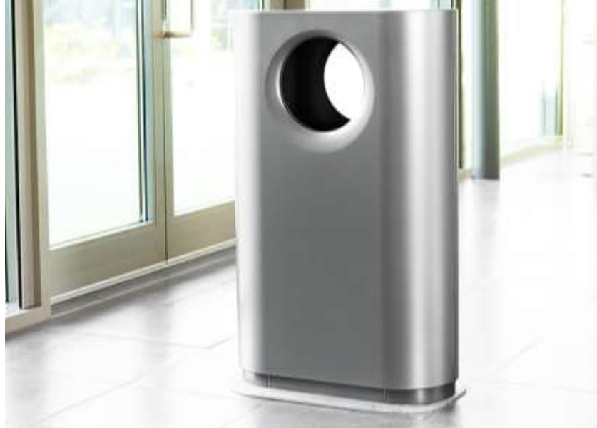
Bildet viser KONSIS 100L frittstående avfallsbeholder