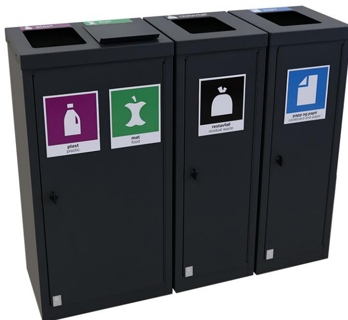
ISTEREN Quatro påsatt etiketter (som eksempel)

Quatro består av sammensatte moduler 1 stk 37231 bred, og 2 stk 37233 smal