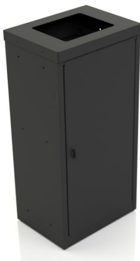
Art. 37236 Isteren Bred – 1 fraksjon – avfallsvolum 60L.