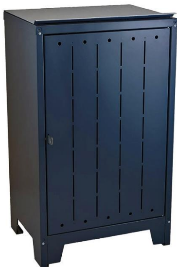
Art.nr.: 32062 Rien 2.0