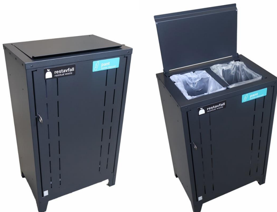
Art.nr.: 32062-9 Rien 2.0 Kilde (todelt sekkeholder)